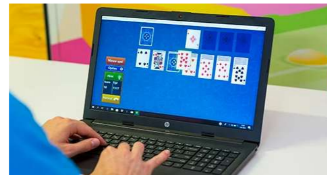
De bridgeclub euverwaeg um euver te sjtampe op patience

Volges de bridgeclub zelf is kaarte waal degelik sjport, um pecies te zeen 'n deensjport. 'Um good te kinne bridge, mooste hiel lag dien herses traine en dien köpke gebrueke', zaet de veurzitter. 'En 't vreug hiel get liechamelike beheersing um op tied oet te sjepe en dien sjlaeg binne te hole. Dat is nog ins get andersj es mèt ellet man achter eine bal aan renne, allein mèt um 'm weer weg te sjtampe este 'm eindelijk hōbs...'